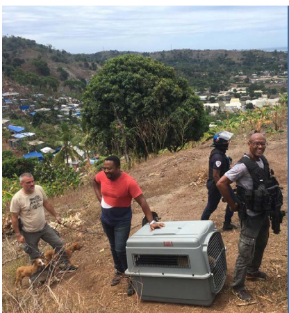
SÉCURITÉ - 09/21

Malgré une défaite, l'équipe féminine de Fuz'Ellipse n'a pas démerité face à la Tamponnaise. En excellant dans leur discipline, les équipes sportives de Mamoudzou mettent la dynamique sportive communale en avant et contribuent à insuffler les valeurs de persévérance à la population.