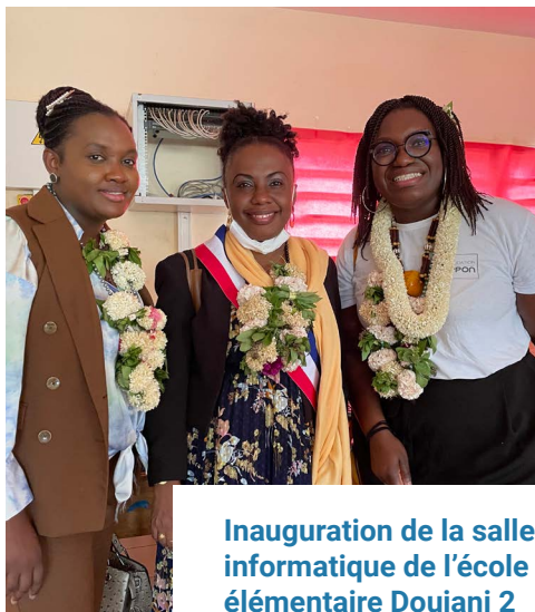
Inauguration de la salle informatique de l'école élémentaire Doujani 2 - 16/02/22