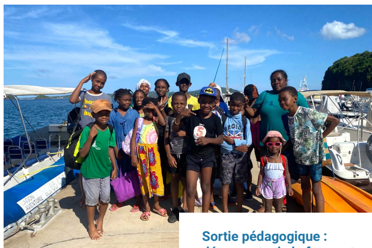
Sortie pédagogique : découverte de la faune et de la flore marine - 29/12/21