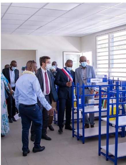
Inauguration de la MJC de Mtsapéré - 03/07/21