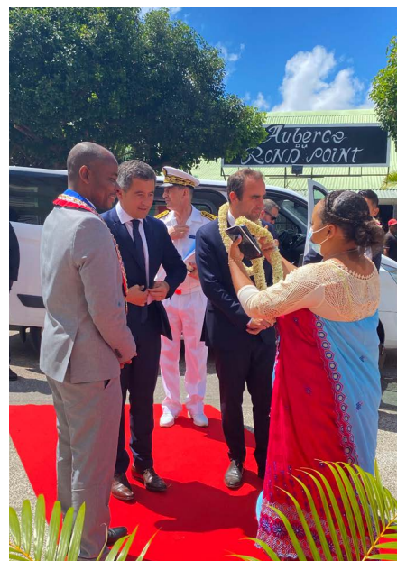
Visite ministérielle - 29/08/21