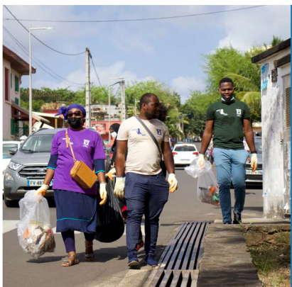
PROPRETÉ URBAINE - 29-30/10/21