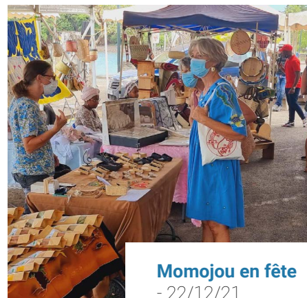
Momoujou en fête - 22/12/21