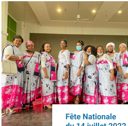
Fête Nationale du 14 juillet 2022