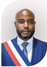
■ Soiyinri MHOUDHOIR

Développement de l'excellence sportive, Vie associative