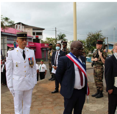
COMMÉMORATION - 11/11/21

La 8ème édition de l'opération Urahafu na Unono s'est déroulée en octobre. Durant deux jours les élus, les agents de la Ville, le tissu associatif et la population se sont relayés pour procéder au ramassage des déchets. Comme chaque année, cette opération permet de sensibiliser la population aux enjeux de la propreté et de la préservation de l'environnement. Grâce à cette événement, la municipalité met l'accent sur les comportements citoyens à adopter pour maintenir la ville propre et améliorer notre cadre de vie.