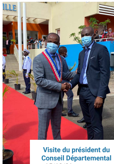
Visite du président du Conseil Départemental - 15/12/21