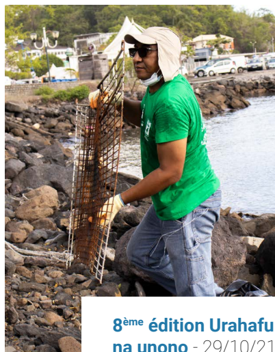
8 ème édition Urahafu na unono - 29/10/21