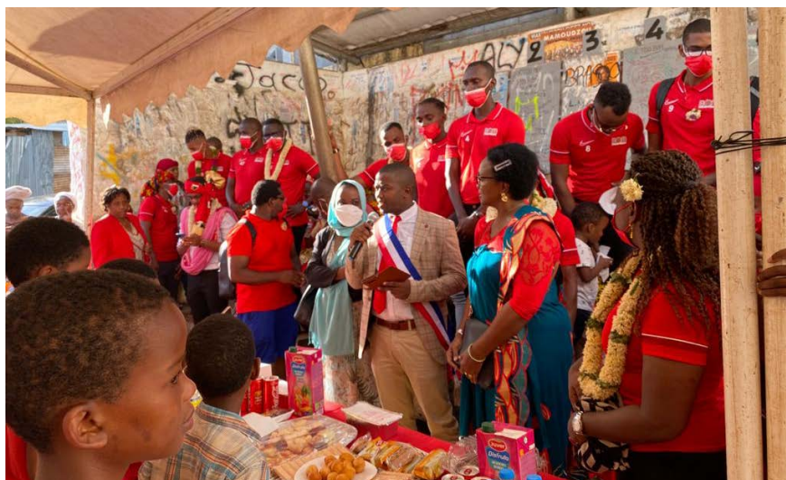
SPORT - 13/12/21

A l'occasion de la commémoration de l'armistice du 11 novembre 1918, la Ville de Mamoudzou a inauguré le monument aux morts situé place Zakia MADI. Érigée à l'honneur des citoyens soldats morts au combat, cette stèle comporte les noms des 17 mahorais morts pour la France. Après celui situé à Dzaoudzi, c'est le deuxième monument aux morts du département.