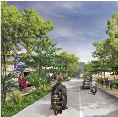
Ci-dessus : la rue SPPM.

Ce projet est cofinancé par le fonds européen de développement régional