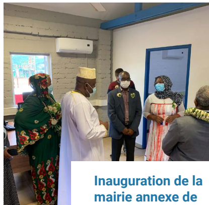
Inauguration de la mairie annexe de Vahibé - 02/06/21